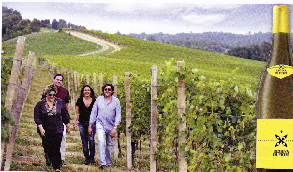
>> Regina di fiori è un Langhe Nascetta doc 100%, coltivata a Trezzo Tinella, nel Cuneese, presso l'azienda della famiglia Bologna (nella foto, in mezzo al vigneto aziendale).